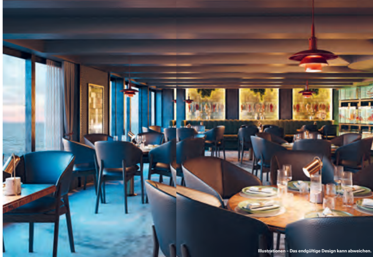
Illustrationen – Das endgültige Design kann abweichen.

Wir werden auch Gastmusiker aus der Region einladen, die Folk, Klassik und andere in Norwegen beliebte Genres spielen.