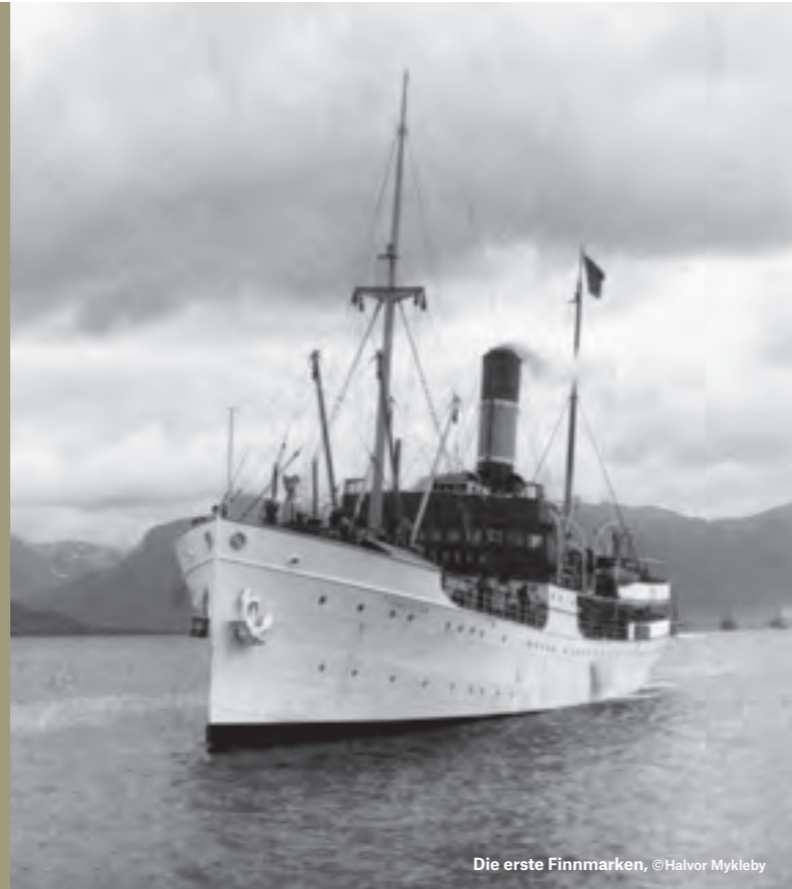
Die erste Finnmarken