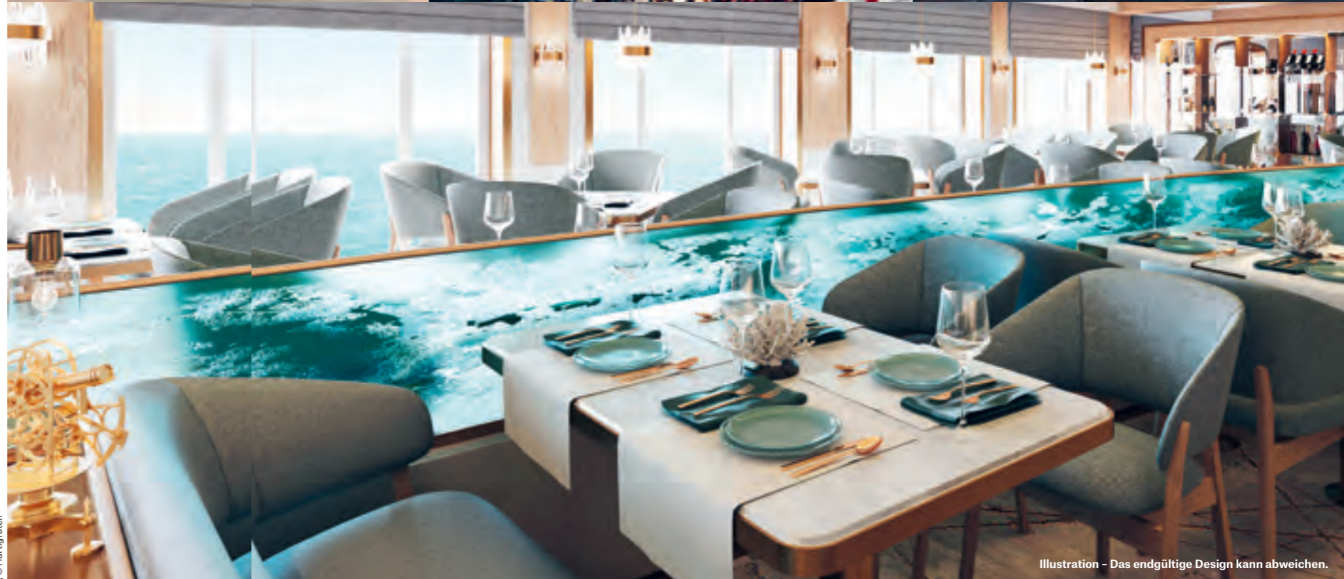
Illustration - Das endgültige Design kann abweichen.