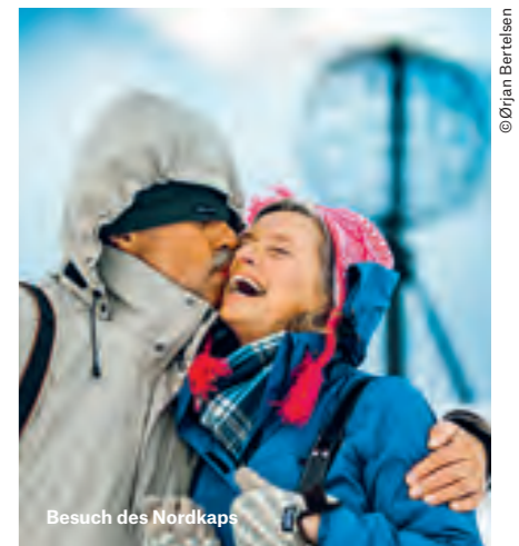
Besuch des Nordkaps

Diese Reise führt Sie in umgekehrter Richtung von Bergen bis nach Oslo. Sie reisen mit der Bergen-Bahn ab Oslo nach Bergen, um von dort Ihre Seereise zu starten. Die Seereise endet in Oslo.