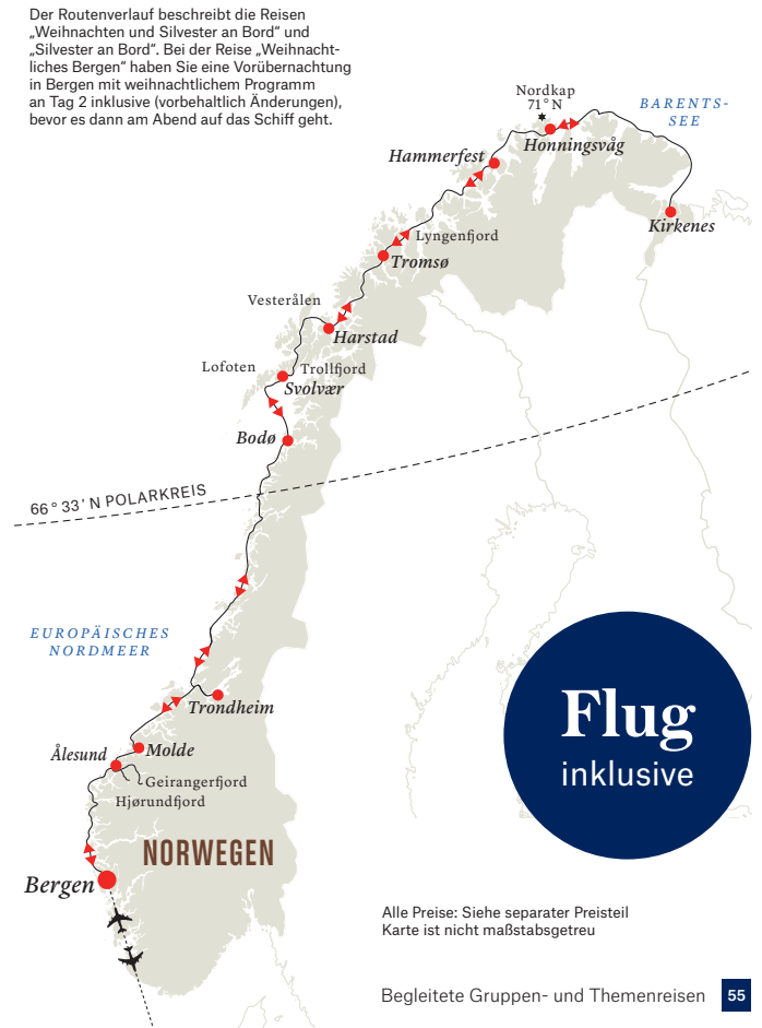
Der Routenverlauf beschreibt die Reisen „Weihnachten und Silvester an Bord“ und „Silvester an Bord“. Bei der Reise „Weihnachtliches Bergen“ haben Sie eine Vorübernachtung in Bergen mit weihnachtlichem Programm an Tag 2 inklusive (vorbehaltlich Änderungen), bevor es dann am Abend auf das Schiff geht.